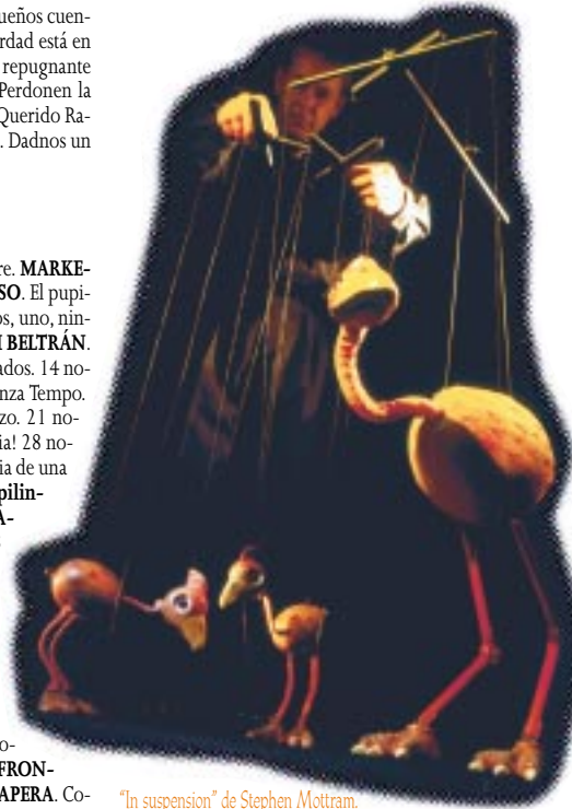
"In suspension" de Stephen Motttram.

TANTTAKA TEATROA . El florido pensil. 16 octubre. YANG FENG PUPPET THEATRE . Escenas de la ópera de Pekín. 19 octubre. PASADAS LAS 4 . Baby Boom en el paraíso. 23, 25 y 26 octubre. LA ZARANDA . Cuando la vida eterna se acabe. 2 noviembre. T'OMBLIGO . Balada tierna