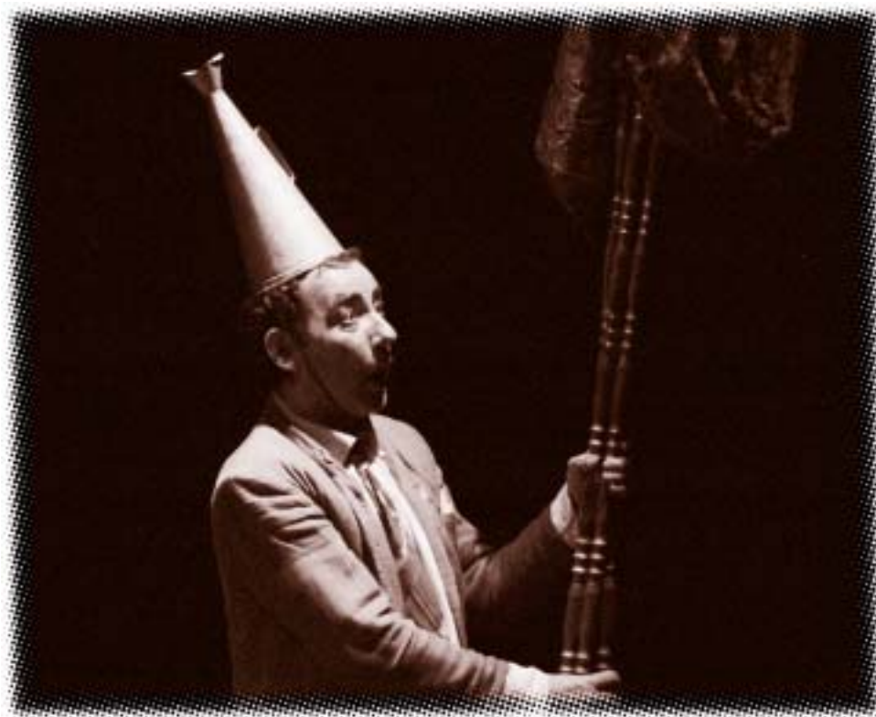
“Ni sombra de lo que fuimos” (La Zaranda).